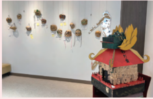
イフュージョン グループ展