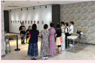
KAGURA Grace ～わたし自身の証明～

名古屋長久手本店2階の一角を改装したアールスペース「ガレリア・アヴァンティ」で開催された展示会をご紹介します。